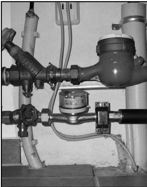
Beispiel einer fachgerechten Installation eines Zwischenzählers